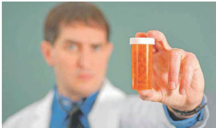
Vo väčšine krajín EÚ sa prihladá pri hodnotení liekov aj na to, či nový liek odpovedá na nenaplnenú medicínsku potrebu.